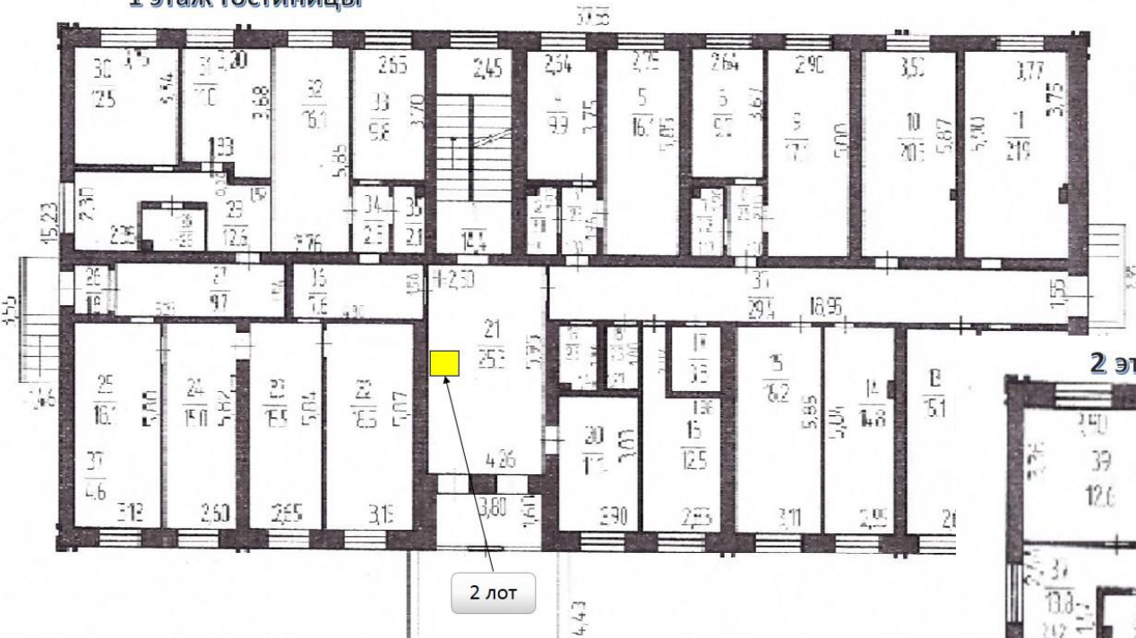
1 этаж Гостиницы