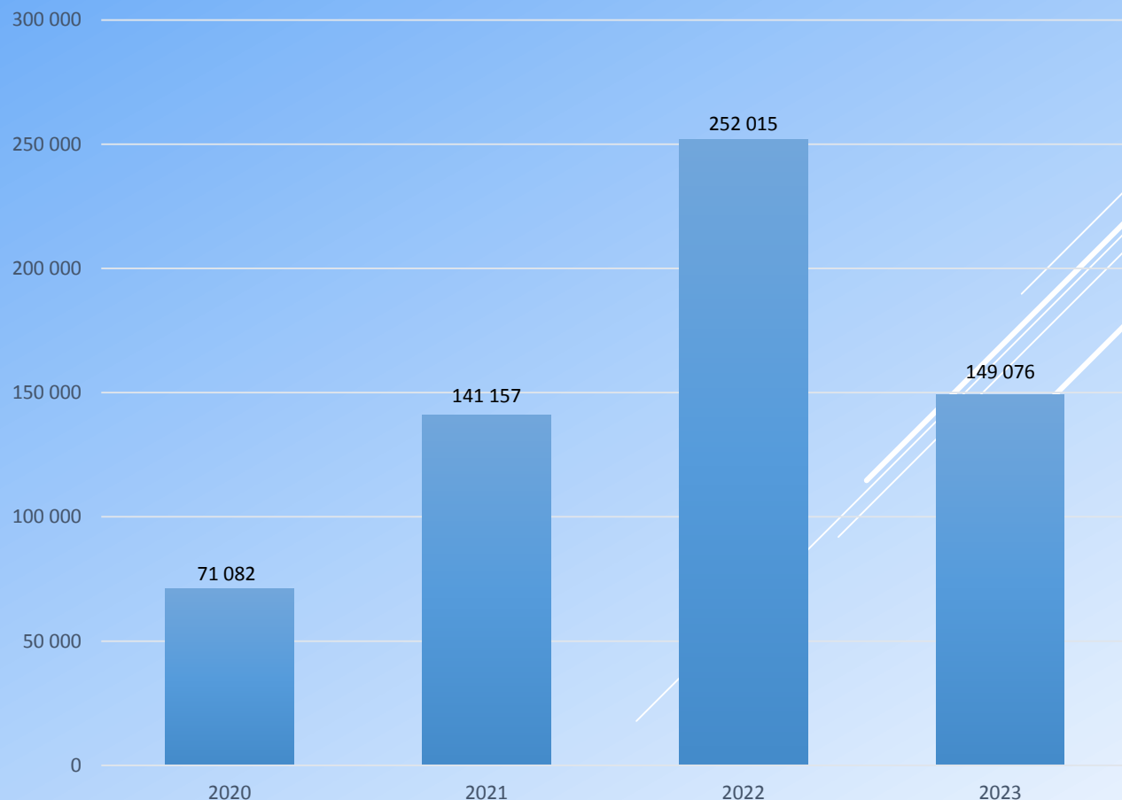
ДИНАМИКА ПАССАЖИРОПОТОКА (тыс. пас.) 2020-2023 г (прогноз)

Обслуживание различных типов пассажирских самолетов (включая вертолеты всех типов)